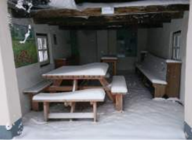
Omdat het zo bijzonder was om te zien, nog twee foto's van de sneeuw in februari: boven een ingesneeuwd Harmenshuusken, onder elzen langs het Ziegenbeek-pad.