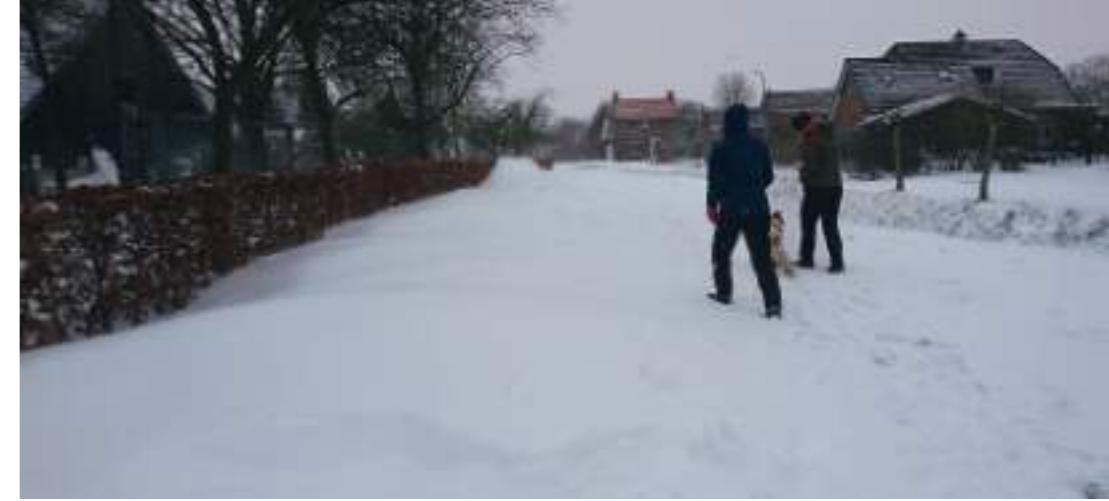
Ziegenbeekpad in de sneeuw