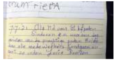
Boven: enkele reacties uit het gastenboek van het Harmenshuusken.