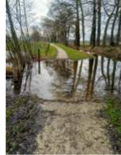
Een meertje op het Meurspad

Dit is per ongeluk gebeurd door een loonwerker die op het aanpalende perceel het gewas aan het klepelen was en de aanplant niet heeft gezien. De bedrijfsleider heeft met ons de schade opgenomen en zal deze volledig vergoeden. Wij gaan dus deze winter maar weer aan de slag om nogmaals nieuwe bomen en struiken te planten. En de singel te voorzien van een degelijke markering. U ziet: het leven van een kerkenpadbeheerder gaat niet altijd over rozen.