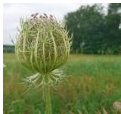
Jammer genoeg deze keer nog geen foto's van de florierende nieuwe aanplant langs het Keizersbeekpad (zie het artikeltje hieronder). Maar de foto's van de fraaie flora en fauna die daar wel is te bewonderen verzachten voorlopig even de pijn